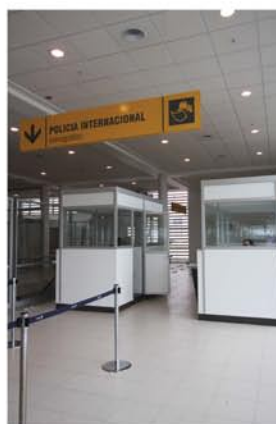
Algunas obras Bercia: Aeropuerto de Iquique Diego Aracena Inacap Talcahuano

En diferentes formatos, acabados y colores, la línea de porcelanatos técnicos de Bercia, ha sido creada con una alta tecnología buscando mejorar la resistencia a la rotura, al choque térmico, y a múltiples agentes químicos, además de una capacidad de absorción de humedad que supera las normas exigidas para estos espacios, garantizando así un alta durabilidad, estética y rendimiento en el tiempo.