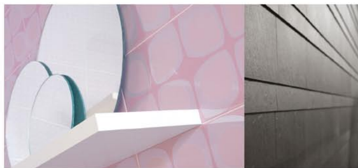
Algunas obras Bercia: Casino Monticello, Clínica Alemana Puerto Varas, Edificio Callao Alcántara.